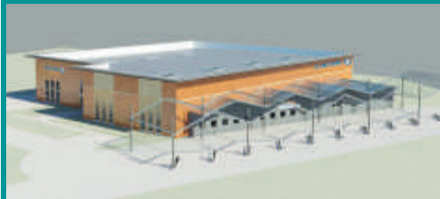
Installation d'un LECLERC DRIVE Zone Saint François Bâtiment réalisé de 2100 m 2