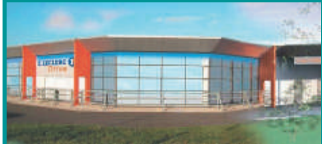
Installation d'un LECLERC DRIVE Bâtiment de 1480 m 2